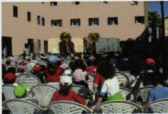
Biblioteca -Terraza de actividades