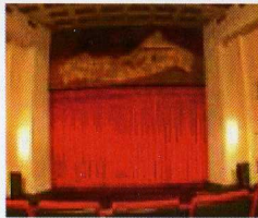
Auditorio Aurelio Guirao