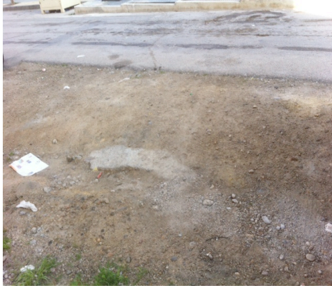
Paraíso de la Ermita