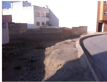
Calle Paraíso de la Ermita